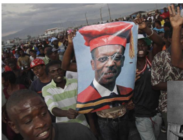
Bilde 1: Følgere av Aristide i Port-au-Prince, mars 2011.