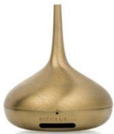
THE PERFUME GENIE 2.0